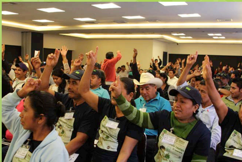
19° Comité de Participantes FCPF 17 de mayo 2015